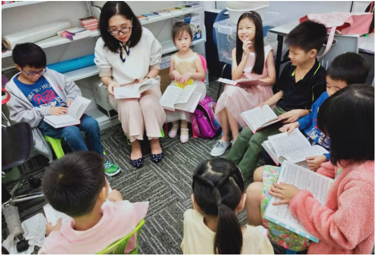
-- 教会儿童主日学【认识神的属性】 --