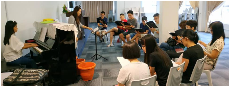
教会诗班练习，星期六 5pm-6.30pm