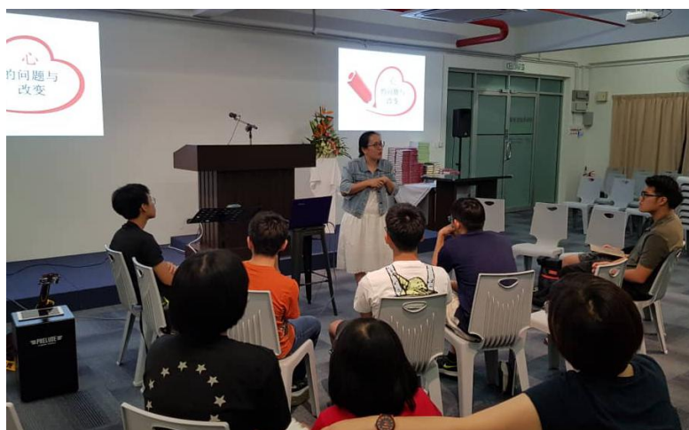
青少年圣经团契聚会, Aug 17, 2019.