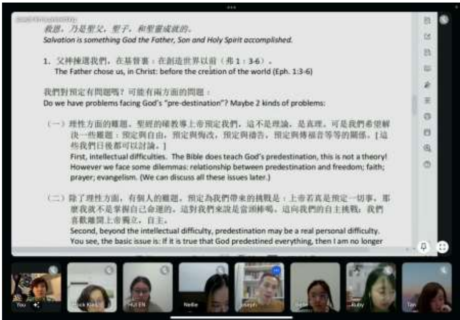
妇人读书会在线上阅读《磐石之上》。。。。。。。