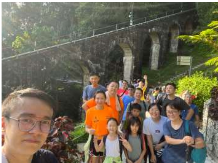
男女老少攀爬升旗山，欣赏上帝的创造！