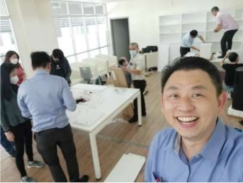
*弟兄姐妹齐心协力安装架子与整理副堂*