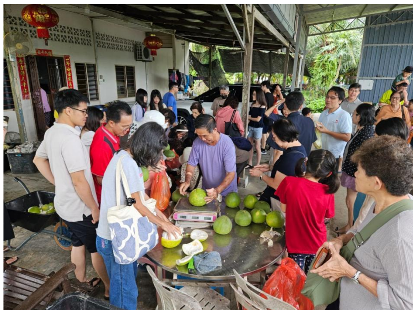
参观! 试吃! 购买!