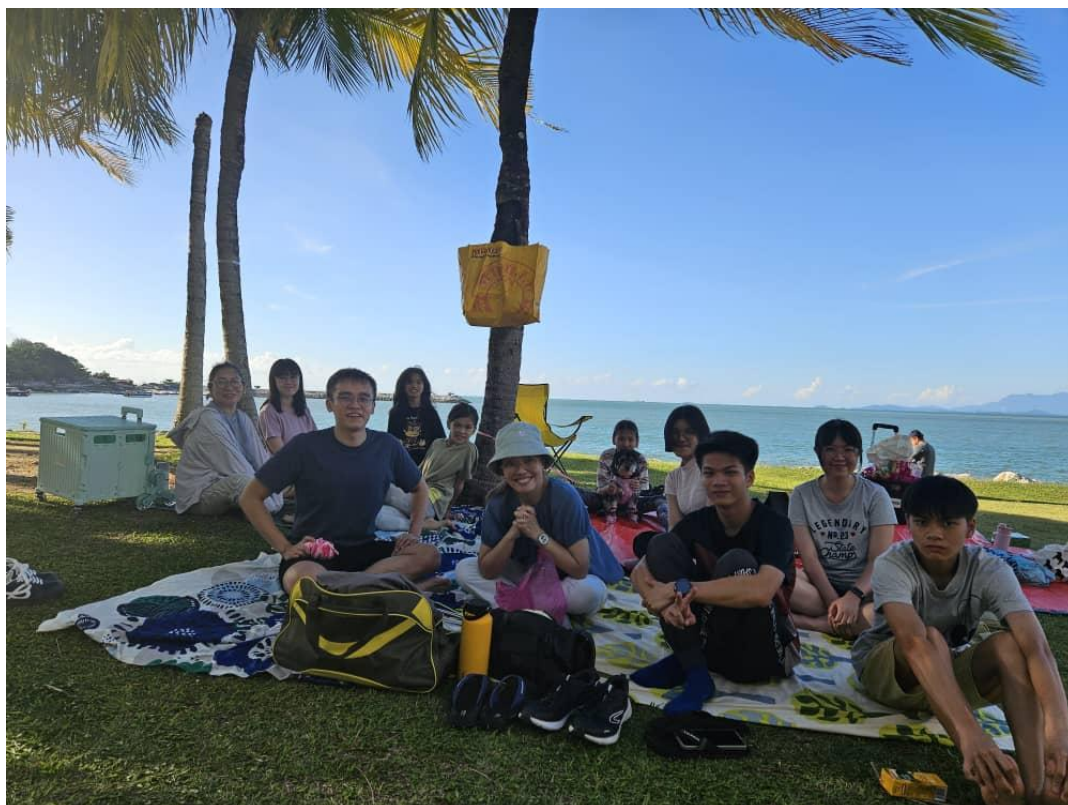
• • 青少年圣经团契于海边野餐聚会 • •